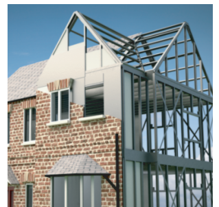
LIGHT STEEL FRAME